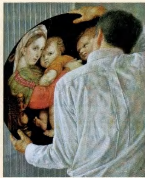
内藤定壽「画家と研究」