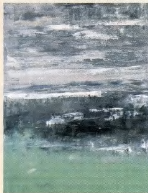
野沢二郎「水際にて」