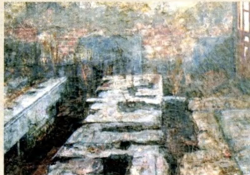
藤田充孝「変電所の跡」